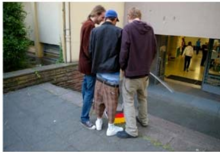
Bilder vom 1. Tag des 30. Bundeskongresses in Bonn. Der 30. Bundeskongress der GRÜNEN JUGEND fand in Bonn statt. Hier die Fotos vom ersten Tag.