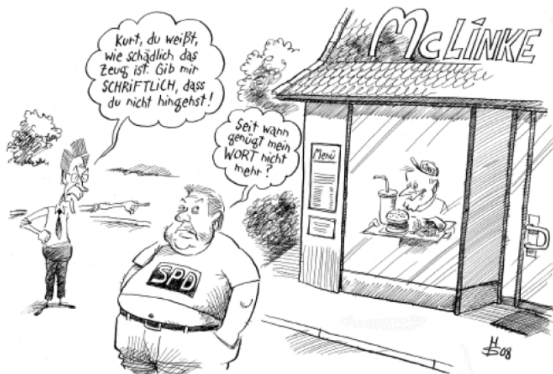
Der Gesundheitsapostel nervt wieder

Wenn es die SPD mit der Entbürokratisierung wirklich ernst meint, sollte sie dieses Instrument schnell wieder einpacken. Auch würden mit der Vermögensteuer gerade gewinnschwache, häufig aber arbeitsplatzintensive Branchen wie z. B. das Baugewerbe besonders betroffen, da die Vermögensteuer an der Substanz und nicht am Gewinn des Unternehmens ansetzt. Hier würde mit der Einführung der Vermögensteuer ein völlig falsches Signal gesetzt. Ziel muss es sein, Arbeitsplätze zu schaffen und nicht zu gefährden. Das Steuerkonzept der SPD verfehlt klar das Ziel: Statt alle Arbeitnehmerinnen und Arbeitnehmer durch Steuersenkungen zu entlasten, plant Parteichef Kurt Beck eine drastische Anhebung der Steuersätze im oberen Bereich. Dabei erinnert das vermeintlich neue Konzept an das Märchen von des Kaisers neuen Kleidern: Altbekannte Modelle werden im neuen Gewand als Heilmittel vorgestellt. Ein neuer Name macht ein falsches Konzept aber nicht besser.