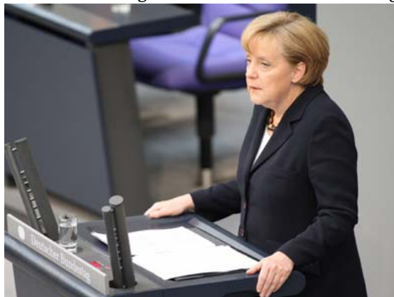
Bundeskanzlerin Dr. Angela Merkel: „Der Einsatz ist notwendig!“

Die Abgeordneten rief die Kanzlerin auf, zu dem erst im Februar beschlossenen Mandat zu stehen. „Wir können von unseren Soldaten nicht Tapferkeit erwarten, wenn uns selbst der Mut fehlt, uns zu dem zu bekennen, was wir beschlossen haben.“ Merkel hob hervor, dass das Mandat über jeden vernünftigen völkerrechtlichen und verfassungsrechtlichen Zweifel erhaben sei. Der Einsatz der Soldaten sei aber nur die letz-