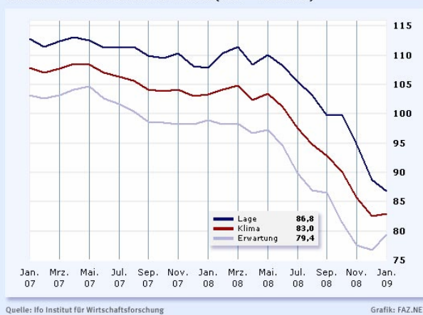
Ifo-Geschäftsklimaindex Januar 2009 Gewerbl. Wirtschaft Gesamtdeutschland (2000 = Index 100)

übermäßige Schulden den Staat nicht handlungsunfähig machen. Die Haushaltskonsolidierung ist aber auch ein Gebot im Sinne der nachfolgenden Generationen. Damit wird klar: CDU/CSU bleiben konsequent auf dem Kurs einer soliden Haushaltspolitik.