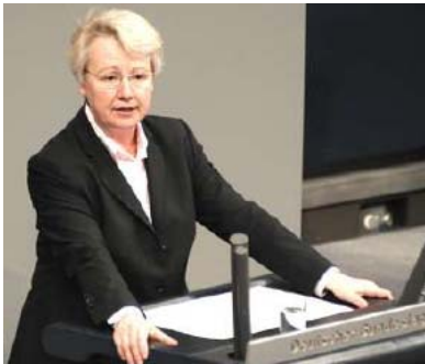
Bundeschulministerin Annette Schavan (CDU) bei ihrer Rede im Deutschen Bundestag

Der Bundestag hat am vergangenen Donnerstag den Entwurf eines Zweiten Gesetzes zur Änderung des Aufstiegsfortbildungsförderungsgesetzes (AFBG bzw. Meister-BAföG) verabschiedet. Das Meister-BAföG ist ein Kernelement der Qualifizierungsinitiative der Bundesregierung. Mit den nun eingeführten Leistungsverbesserungen sorgen wir für die richtigen Weichenstellungen, um noch mehr Menschen als bisher für Fortbildungen zu gewinnen und einen qualifizierten Fachkräftenachwuchs sicher zu stellen.