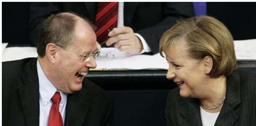
Finanzminister Steinbrück, Kanzlerin Merkel in der Haushaltsdebatte: "Die Große Koalition hat Fortune"

In Erster Lesung haben wir das Haushaltsgesetz 2009 beraten. Der von der Bundesregierung vorgelegte Entwurf und der Finanzplan 2012 sind eine fundierte Grundlage für die nun folgenden Beratungen in den Fachausschüssen. Die Konsolidierung des Bundeshaushalts ist gut vorangeschritten. Das Ziel des ausgeglichenen Haushalts im Jahr 2011 wird bekräftigt, indem der weitere stufenweise Abbau der Nettokreditaufnahme in den Jahren 2009 und 2010 beschränkt wird. Der Bundeshaushalt 2009 sieht Ausgaben von 288,4 Mrd. Euro vor, dies sind 1,8% mehr als im Vorjahr. Davon entfallen 25,9 Mrd. Euro auf Investitionen, 42 Mrd. Euro auf Zinsausgaben. Die Nettokreditaufnahme soll auf 10,5 Mrd. Euro sinken. Ab 2011 soll ein ausgeglichener Haushalt vorgelegt werden. Eine geringere Nettokreditaufnahme als 2009 mit 10,5 Mrd. Euro gab es zuletzt im Jahre 1989.